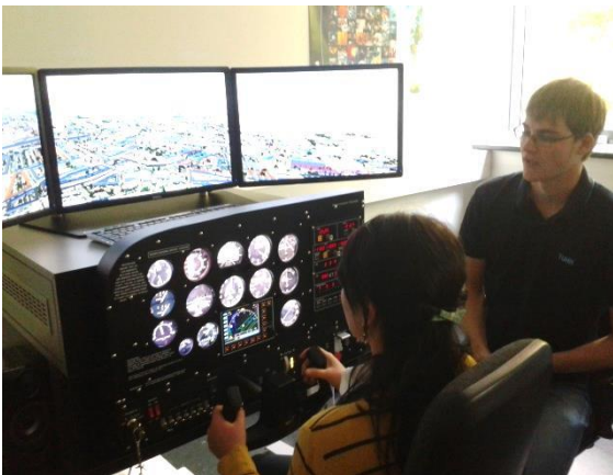
Besuch der TU-Harburg (Flugsimulator) Visit of the TU-Harburg (flight simulator)

Sie lernen Deutsch bei MuttersprachlerInnen. Wir verwenden dazu aktuelle authentische und literarische Texte, Lehrwerke und Audio- und Videomaterial. Alle Lehrmaterialien sind in der Kursgebühr enthalten.